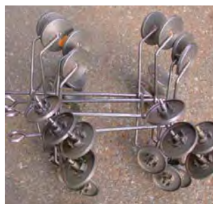
塗装治具の塗料除去