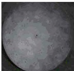
スパッタリング治具異物除去