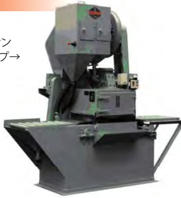
ショットブラストマシン コンベアタイプ→