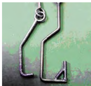
塗装治具の塗料除去