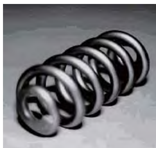
ショットピーニング加工