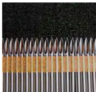
注射針刀先バリ取り