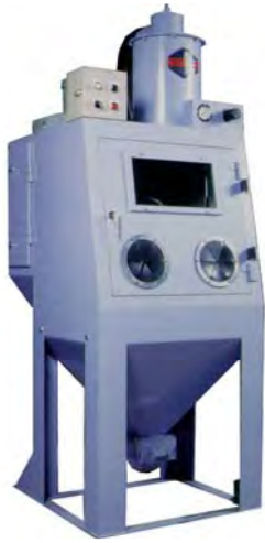
↑エアブラストマシン