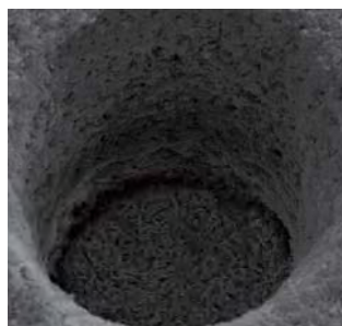
精密処理(ホールの拡大図)