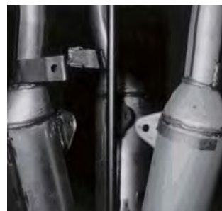
溶接加工後のスケール除去